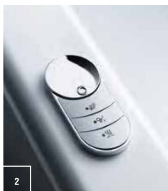
2_comando Cross control commande Cross control Cross control