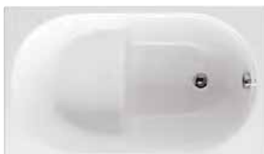
astor-S 120x70 | 105x70