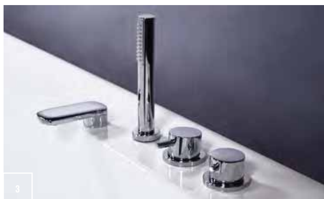
3_rubinetteria robinetterie tapware