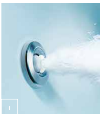
1_getto whirlpool jet whirlpool whirlpool jet