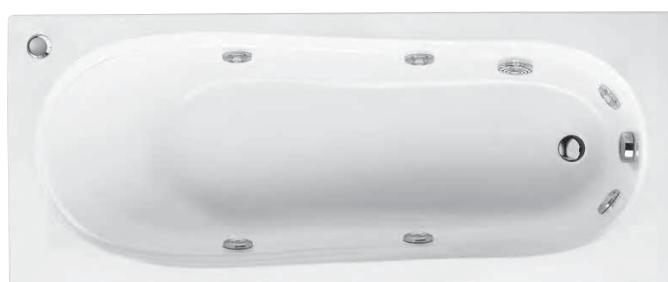
astor 170x70 | 160x70 | 150x70