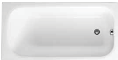
astor 140x70 | 105x70